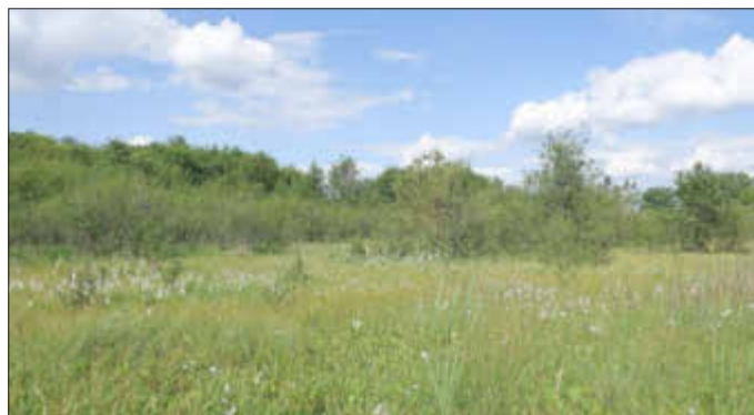
Blick in das Zwischenmoor, im Vordergrund gut zu erkennen, die Wollgrasbestände, die mehr und mehr von Gebüsch überwachsen werden.

Jeder der Lust und Zeit hat, möge sich bitte melden unter info@lebensraum-almuehltal.de oder Tel.: 0981 468 4450.